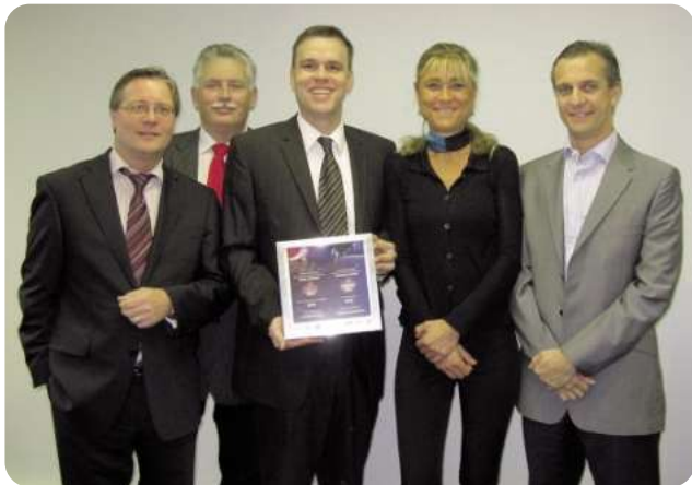
De algemene directie van DPD BELUX krijgt de prijs overhandigd.

Voor de eerste keer hebben het bekende economische tijdschrift «Trends» alsook het gespecialiseerde tijdschrift «Transport Management & Logistics» samen en naar het voorbeeld van de Trends Gazellen een rangschikking opgemaakt van de toonaangevende ondernemingen voor transport en logistiek in België. In de categorie grote ondernemingen (jaarlijkse omzet > EUR 10 miljoen) staat DPD (Belgium) NV op plaats 3 (na DHL Worldwide Express en 2XL). De genomineerde ondernemingen werden beoordeeld volgens de 3 criteria omzet, cash flow en het aantal werknemers. Om gekozen te worden, moest een onderneming ook nog aan de volgende voorwaarden voldoen: onafhankelijk werken, minstens 5 jaar bestaan en minimaal 20 arbeidsplaatsen gecreëerd hebben sinds haar oprichting.