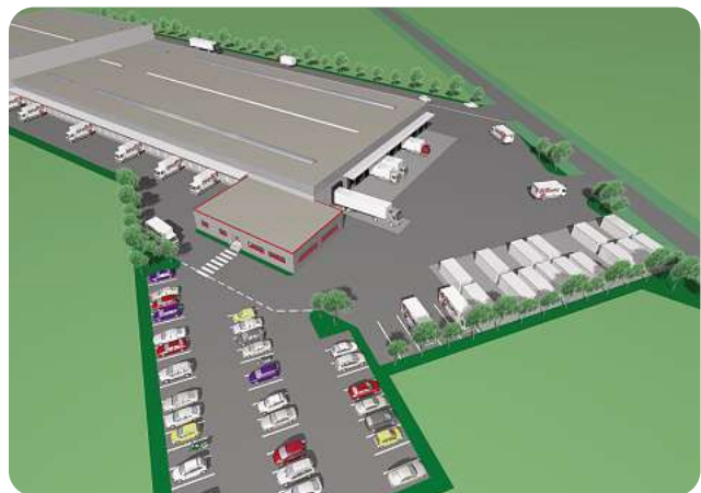
Visualisatie van het nieuwe depot in Aalter/depot nr. 536 in Oost-Vlaanderen.

DPD BELUX investeert in nieuwe depots in de economische regio's België en Luxemburg. Op beide plaatsen zijn er al depots die nu vervangen worden door nieuwe gebouwen. Met deze stap wil DPD de service verder verbeteren en in de toekomst investeren. Volgens de planning zouden beide vestigingen in het midden van 2009 operationeel moeten zijn.