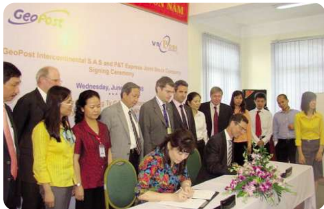
Foto van de ondertekeningssceremonie in Hanoi.

GeoPost Intercontinental heeft een officiële overeenkomst ondertekend met een dochteronderneming van Vietnam Post, zodat de klanten in Vietnam hun pakketten voortaan via DPD Classic Network naar Europa kunnen versturen. De Europese markt is een van de hoofdbestemmingen voor de Vietnamese exporteurs en ook een van de belangrijkste sterke punten van het DPD-netwerk. De toegang tot het globale netwerk van DPD zal de ondernemingen in Vietnam helpen hun logistieke kosten te verlagen terwijl een hoog niveau van kwaliteit behouden blijft.