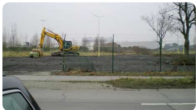
De bouwwerken in Aalter zijn begonnen.

DPD BELUX investeert in nieuwe depots in de economische regio's België en Luxemburg. Op beide plaatsen zijn er al depots die nu vervangen worden door nieuwe gebouwen. Met deze stap wil DPD de service verder verbeteren en in de toekomst investeren. Volgens de planning zouden beide vestigingen in het midden van 2009 operationeel moeten zijn.