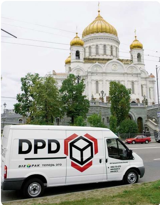
DPD in Rusland.

Sinds eind 2007 oefent de groep Armadillo haar activiteiten uit onder de internationale merknaam DPD. Het re-brandingproces in Rusland werd gelanceerd in maart 2007. De volgende nationale organisaties die zullen werken onder de merknaam DPD, zijn Parceline UK en Interlink Ireland.