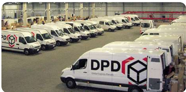
Het aantal verwerkte pakjes in Courcelles stijgt voortdurend.

Op 2 januari 2007 openden we onze vierde vestiging in België – depot 534 – in Courcelles. Deze vestiging bestaat intussen meer dan een jaar en in die tijd heeft Courcelles bijna 2 miljoen pakjes verwerkt. Het filiaal heeft ongeveer 25 medewerkers en 65 chauffeurs in dienst. Dankzij de ideale strategische ligging van Courcelles kunnen wij voortaan onze klanten in het zuidwesten van België beter bedienen.