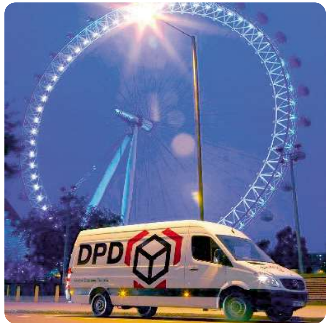
«Een DPD-voertuig voor de London Eye.»