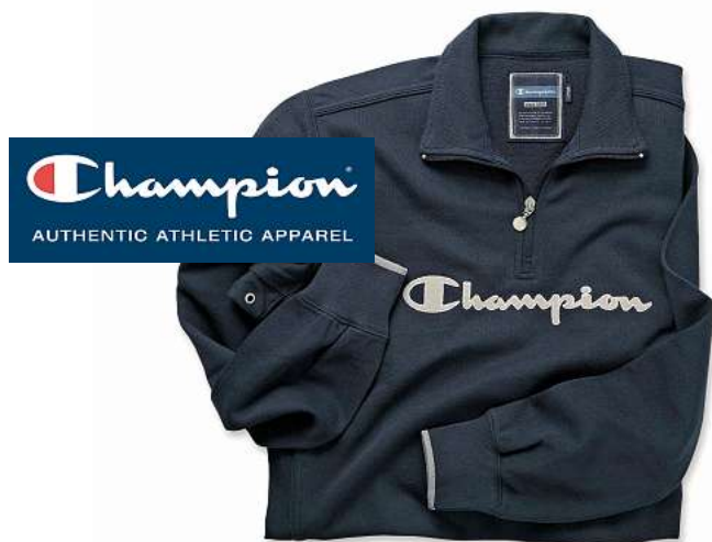
«Een topseller van Champion – de American classic.»

Het is ook een koploper op het gebied van innovatiegerichte sportkledij en biedt atleten de beste kledij en gerelateerde producten in de wereld. Champion biedt een volledige lijn van sportkledij, gaande van hoogwaardige sporttruien, over klassieke katoenen T-shirts tot perfect aanpassend ondergoed. Champions streefdoel is het aanbieden van de beste sportkledij, dus het is de doelstelling van DPD om de best mogelijke service aan te bieden.