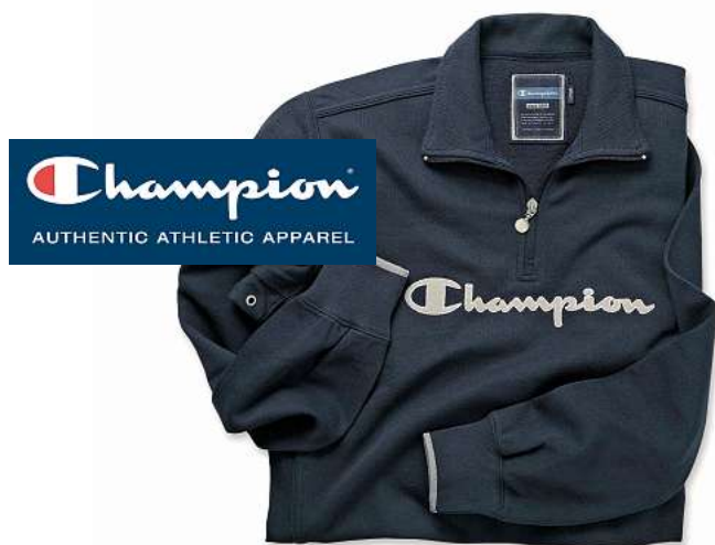
Quelques unes des meilleures ventes de Champion – l'américain classic.

Il s'agit aussi d'un pionnier de l'innovation dans le secteur des vêtements de sport, qui propose aux athlètes les équipements et les accessoires les plus sophistiqués du monde. Champion commercialise une gamme complète de vêtements sportifs allant des sweatshirts haute performance aux sous-vêtements parfaitement adaptés à la pratique du sport, en passant par les classiques tee-shirts en coton. Champion cherche en permanence à proposer les meilleurs vêtements de sport, de la même façon que DPD met toujours tout en œuvre pour proposer le meilleur service possible.