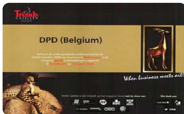
La Gazelle Trends 2008 décernée à DPD.

Tous les ans, l'hebdomadaire économique Trends récompense certaines grandes sociétés en leur décernant ses fameuses «Gazelles». C'est parmi les 100.000 plus grandes sociétés que Trends désigne celle qui mène ses activités avec le plus de succès en termes d'entrepreneuriat, d'offres compétitives et bonne ambiance de travail. En 2008, DPD (Belgique) a remporté une «Gazelle» dans la catégorie «plus forte croissance: grandes entreprises» pour la province d'Anvers!