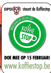
L'autocollant Koffie Stop.