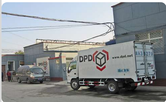
Une camionnette DPD en Chine.

Les échanges mondiaux de marchandises ne cessent de s'accroître. Dans ce contexte, il faut absolument assurer des relations rapides et fiables entre les «tigres» à forte croissance d'Asie, du Moyen-Orient et d'Amérique Latine et les pays européens à forte consommation. DPD étant l'une des principales sociétés européennes de courrier et de colis express, elle s'est fixé pour objectif de développer l'exploitation des marchés globaux. DPD privilégie dans cette optique le développement de ses propres structures sur les marchés-clés ainsi que des collaborations avec des partenaires stratégiques.