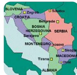
Un aperçu de la structure des dépôts de l'Europe du Sud-Est.

En reprenant l'ensemble des parts de DPD Slovénie et de DPD Croatie, GeoPost vient de consolider sa position sur le marché l'Adriatique. Grâce à ses plates-formes implantées à Maribor, Zagreb, Belgrade et Sarajevo ainsi que ses douze dépôts répartis dans toute la région, DPD occupe une position idéale pour répondre aux besoins des clients dans cette région marquée par une forte expansion économique.