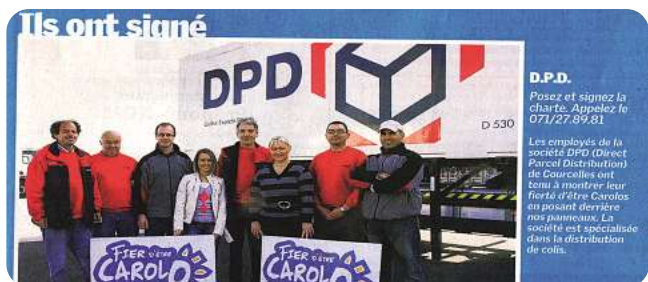
«Fier d'être Carolo»

Le 26 mai dernier, La Nouvelle Gazette a publié un article concernant une initiative destinée à redorer le blason de la ville de Charleroi (vu les déboires de ces dernières années au niveau politique et social). Différents collaborateurs de DPD et plusieurs sociétés de la région ainsi que des particuliers soutiennent cette action en s'engageant à respecter la charte suivante: