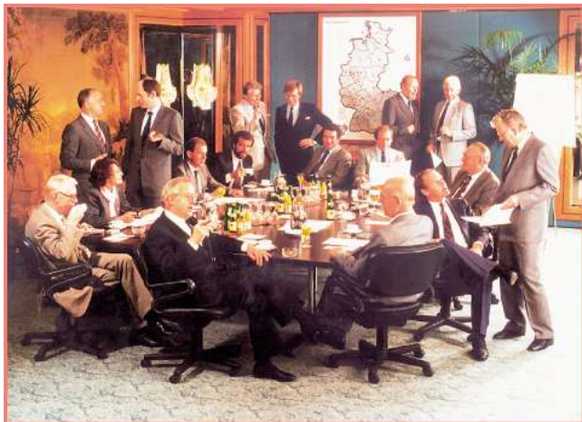
Les «visionnaires» en 1976.

Le signal de départ – Fusion de 18 sociétés de transport allemands désireuses de créer une solution d'expédition de colis plus simple, plus rapide et plus fiable que l'ancienne Poste Fédérale Allemande.