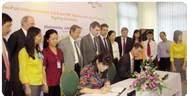
Photo de la cérémonie de signature du contrat à Hanoi.

GeoPost Intercontinental vient de signer un accord officiel avec une filiale de la Poste vietnamienne afin d'offrir aux clients de ce pays la possibilité d'expédier des colis vers l'Europe grâce au réseau DPD Classic. Le marché européen est en effet l'une des principales destinations des exportateurs vietnamiens et constitue par ailleurs l'un des atouts majeurs du réseau DPD. L'économie et le commerce vietnamiens pourront ainsi profiter d'un accès au réseau global DPD tout en réduisant leurs coûts logistiques et en gardant un niveau qualitatif élevé.