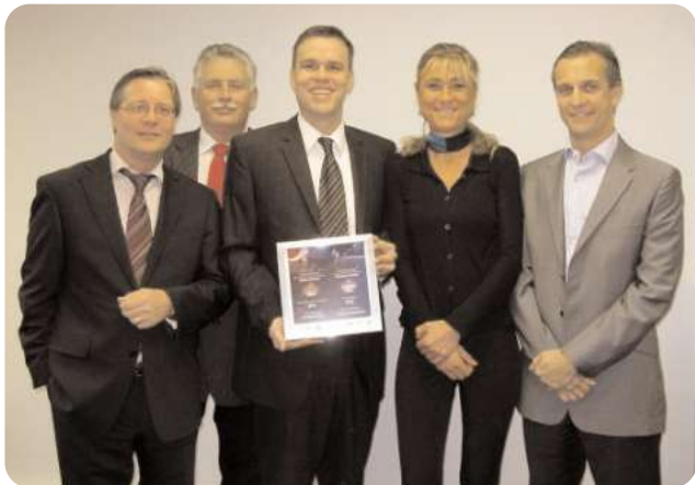
L'équipe de la Direction Générale de DPD BELUX présente sa récompense.

Le célèbre magazine économique «Trends», de même que le magazine spécialisé «Transport Management & Logistics» ont pour la première fois classé conjointement les principales sociétés de transport et de logistique de Belgique, suivant ainsi l'exemple des «Trends Gazelles». Dans la catégorie des grandes entreprises (chiffre d'affaires annuel >10 millions EUR), la SA DPD (Belgium) s'est classée en troisième position (derrière DHL Worldwide Express et 2XL). Les sociétés nominées ont été évaluées sur la base de trois critères différents: le chiffre d'affaires, le cash flow et le nombre de salariés. Pour être retenue, l'entreprise devait aussi respecter les règles suivantes: travailler de façon indépendante, exister depuis au moins 5 ans et avoir créé au moins 20 emplois depuis sa fondation.