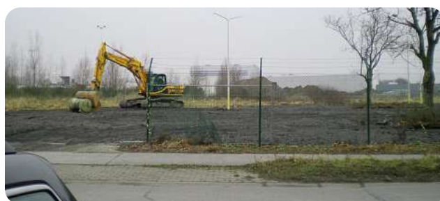
Les travaux à Aalter ont commencé.

DPD BELUX investit dans de nouveaux dépôts dans la zone économique belgo-luxembourgeoise. Il existe certes déjà des dépôts à ces deux endroits mais ceux-ci vont être remplacés par de nouveaux bâtiments. Par ces projets, DPD souhaite encore améliorer le service à la clientèle tout en investissant dans l'avenir. Ces deux nouveaux dépôts devraient être opérationnels vers le milieu de l'année 2009.